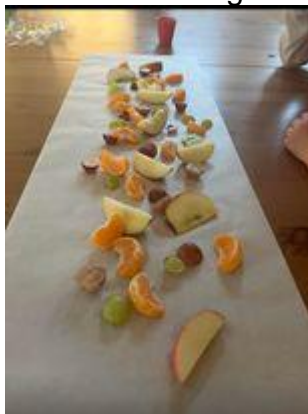
Sunn og god mat er viktig i barnehagen