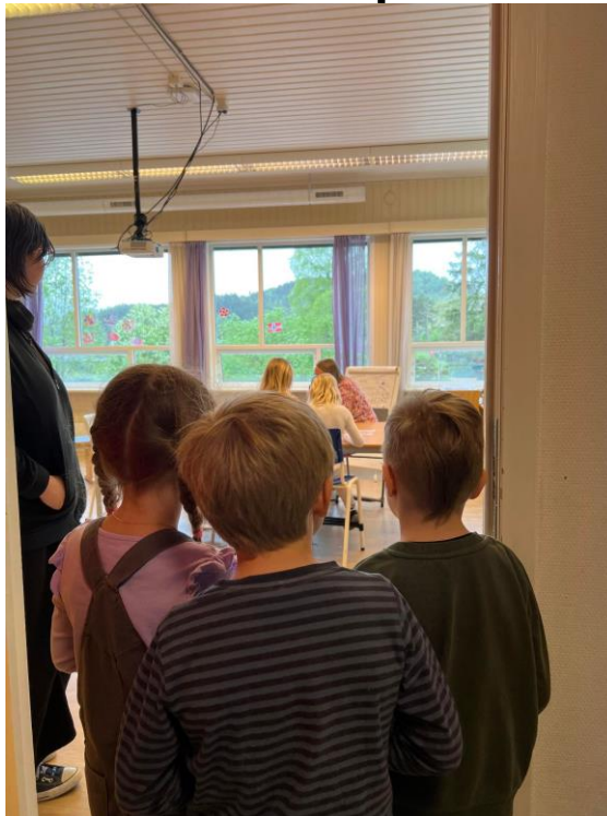
Ein liten kikk inn i skulestova.