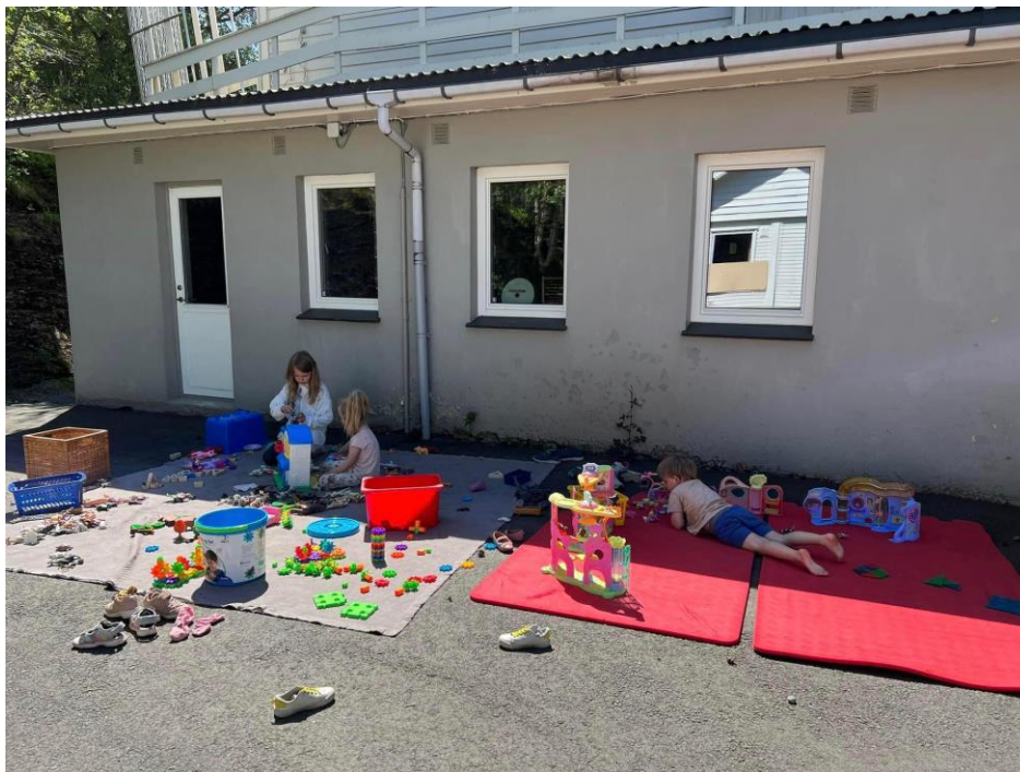
Leiken har stor plass i barnehagen vår

Denne planen for Imsland barnehage byggjer på Rammeplanen frå Kunnskapsdepartementet